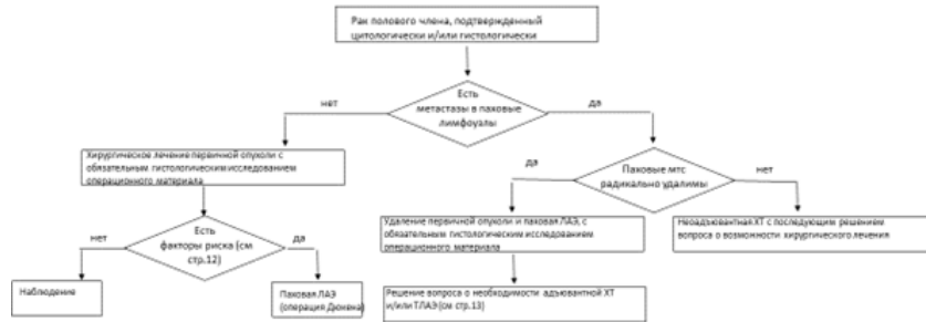
Блок-схема лечения пациента с верифицированным раком полового члена